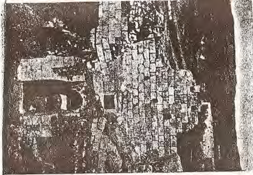
دیتهنی ناسه وهری په رستگه یه کی میهر له نیشاپوری نرنگ به کارون که لیکوله ره وه کان به په رستگه و ناور که دهی زهرده شتی ناوده بن.