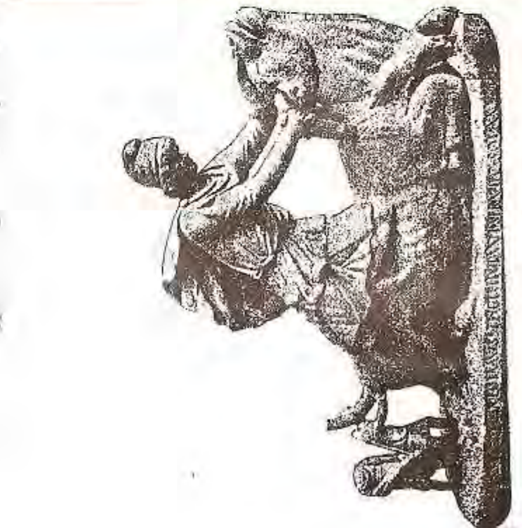
میترا یومی ته‌ور یایی لسه‌ر بناغدی قلمسه‌ته و نده‌سانه ته‌ور یاییه‌کان په‌روی سه‌نده و گشت ته‌و داستانه زوروی لسه‌ر « میهر »